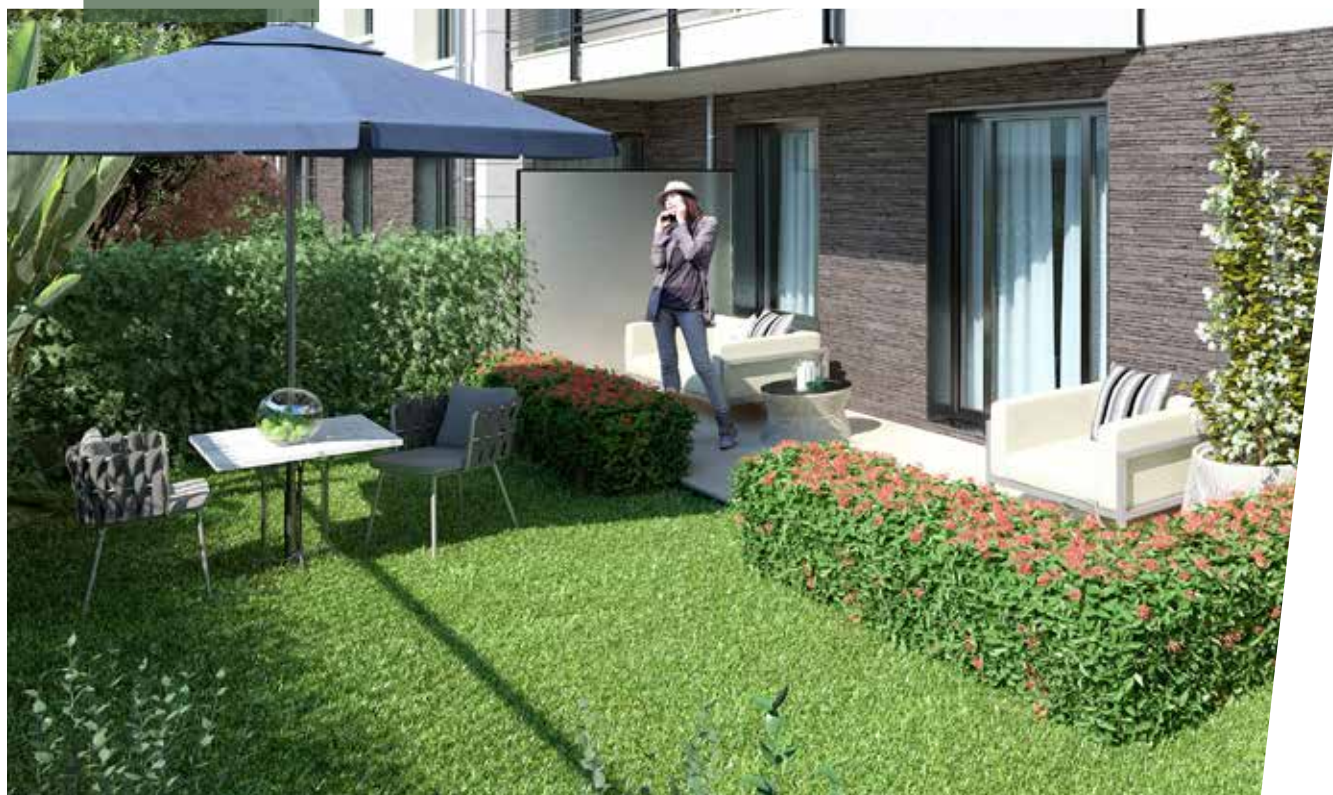
Un jardin privatif